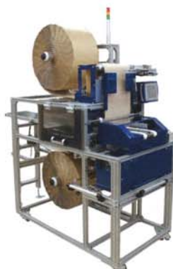
バブルシート包装機