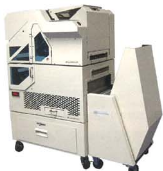
全自動コミックシュリンカー-RAPO1400

包装機器メーカーとして設立され、コミック包装機「コミックシュリンカー」は、書店市場の9割のお客様にご利用いただいています。近年では物流業界やコンビニ業界にも参入し、新たな独自製品の開発に尽力しています。